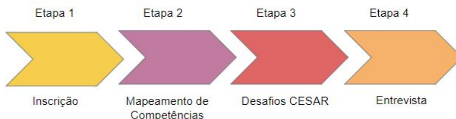
Figura 1: Etapas do Processo Seletivo

Etapa 1: Inscrição - corresponde à indicação da intenção dos candidatos em participar do processo seletivo.